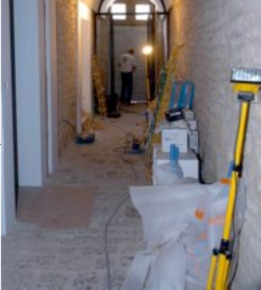
Pierres séculaires dans l'entrée.

une base traditionnelle, en même temps créative et ouverte sur le monde. » Même principe qu'au Ban, cinq entrées, quatre poissons, autant de viandes, cinq desserts, en fonction des saisons. Tarifs : entre 9 et 20 € le plat.